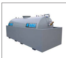
Cistern i öppen miljölåda.