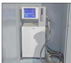
Låsbart skåp för mackpump.