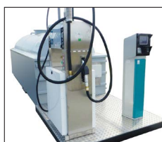
Plattform för pump och terminal.